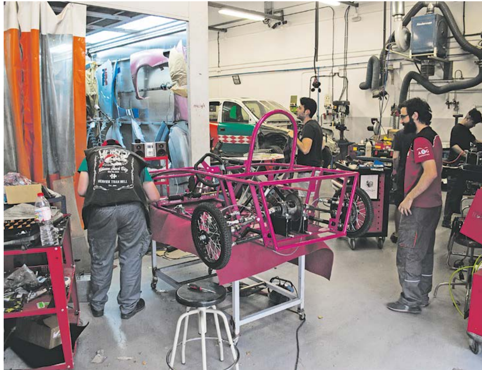
Els alumnes del Palau Ausit acaben de muntar un vehicle elèctric /x.o.

Els plànols del vehicle els van fer amb Sòlid Works, un programa de CAD per dissenyar. "Ho vam fer tot digital, després vam imprimir tots els plànols i com que ja ho teníem tot perfectament encaixat, la